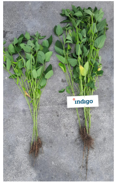
КОНТРОЛЬ ІНДИГО® 30 ВС