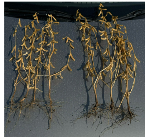
КОНТРОЛЬ ІНДИГО® 30 ВС